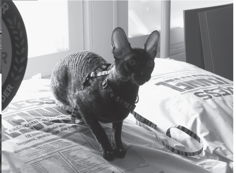
Cornish Rex, 6 mån