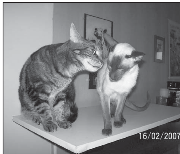
Meja och Frasse