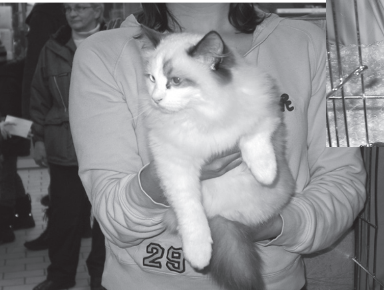
Här har vi en söt liten ragdoll